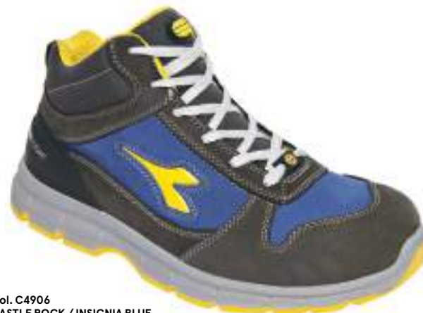
Col. C4906 CASTLE ROCK / INSIGNIA BLUE