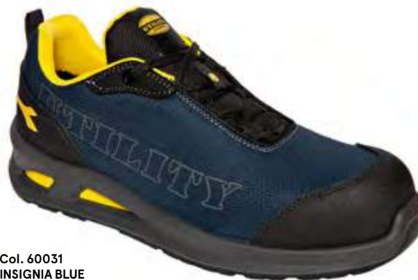
Col. 60031 INSIGNIA BLUE