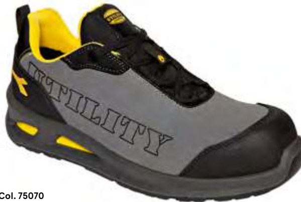
Col. 75070 STEEL GRAY