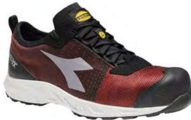
Col. C2461 RED / WHITE

Gomma nitrilica HRO, Vibram Litebase Technology