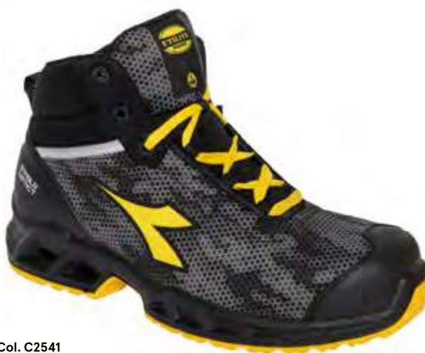
Col. C2541 BLACK / GRAY