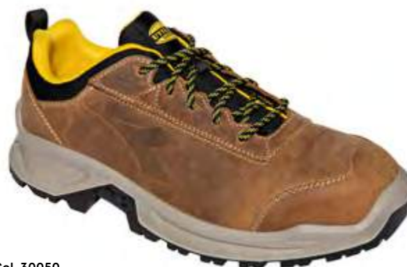
Col. 30050 DARK BROWN