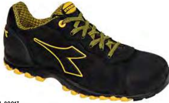
Col. 80013 BLACK