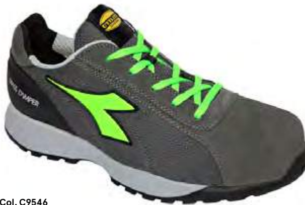
Col. C9546 COAL / GREEN FLUO