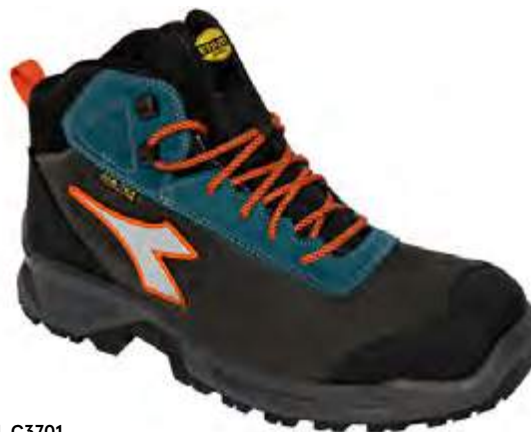
Col. C3701 CASTLE ROCK / BLUE MOON