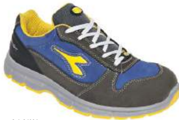
Col. C4906 CASTLE ROCK / INSIGNIA BLUE