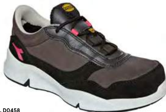
Col. D0458 NINE IRON / RASPBERRY