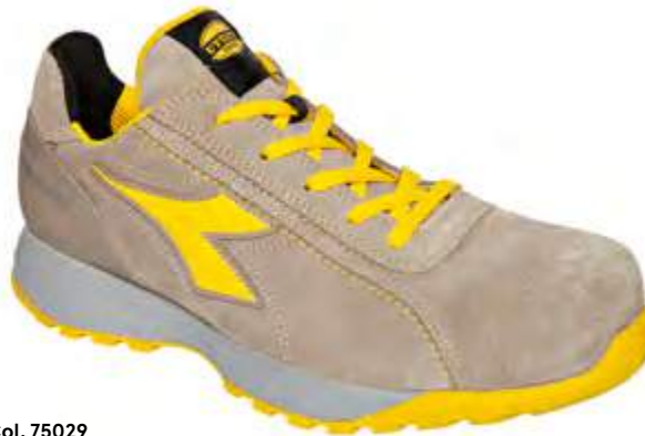
Col. 75029 MOON ROCK GREY