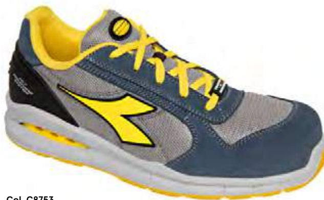
Col. C8753 BLUE COSMOS / MOON ROCK GRAY