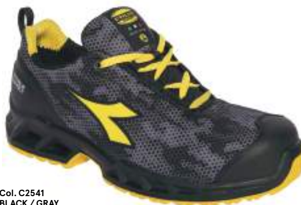
Col. C2541 BLACK / GRAY