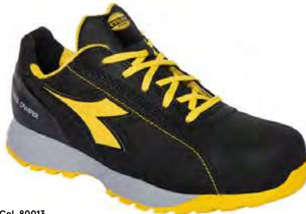
Col. 80013 BLACK