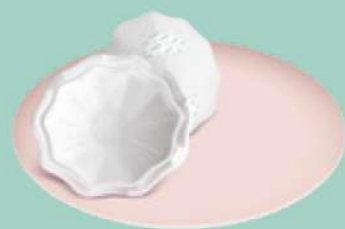
Include due coppette per il seno